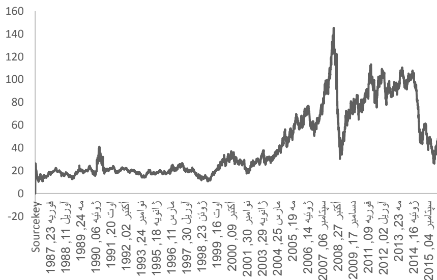
نمودار ۱. داده‌های روزانه قیمت نفت خام بازار وست تگزاس اینترمدیت

در این مقاله از داده‌های روزانه قیمت نفت خام بازار وست تگزاس اینترمدیت (WTI) از تاریخ ۱۹۸۶/۰۱/۲ تا تاریخ ۲۰۱۶/۱۰/۱۷ استفاده شده است که از تاریخ ۱۹۸۶/۰۱/۲ تا ۲۰۱۶/۰۸/۲۹ به عنوان بازه زمانی درون‌نمونه‌ای برای برآورد مدل‌های مقاله و مابقی مشاهدات از بازه زمانی ۲۰۱۶/۰۸/۳۰ تا ۲۰۱۶/۱۰/۱۷ به عنوان بازه زمانی پیش‌بینی برون‌نمونه‌ای به منظور ارزیابی پیش‌بینی برون‌نمونه‌ای استفاده شده است.